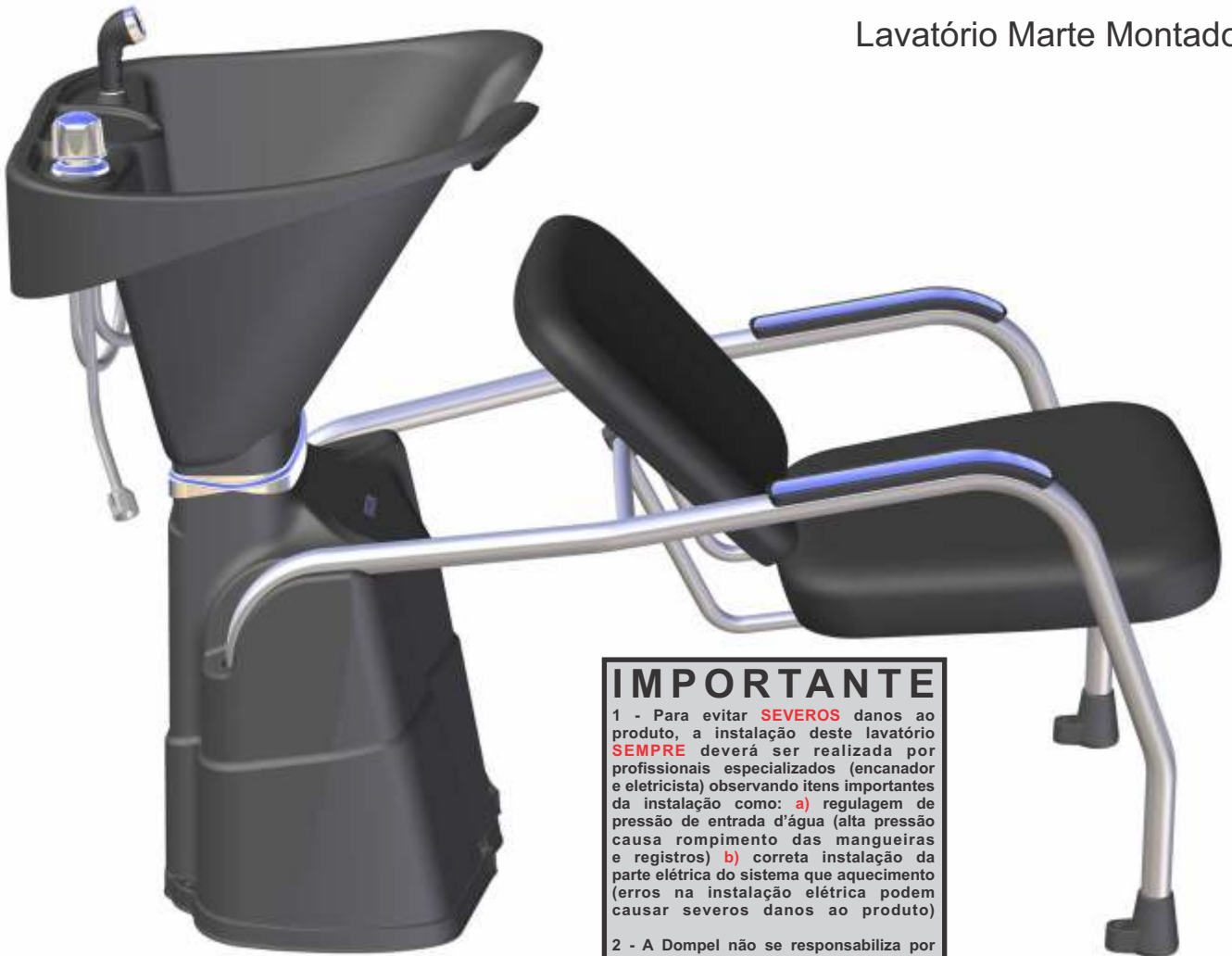
Lavatório Marte Montado